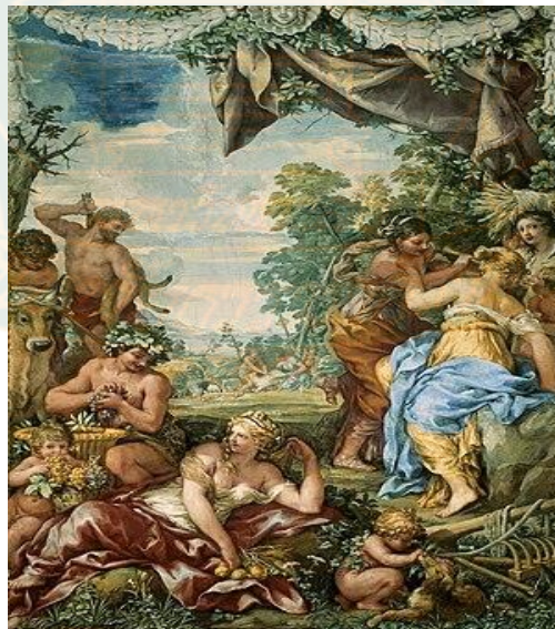
'The Golden Age' ในอีกมุมมอง เป็นภาพวาดของ 'Pietro da Cortona' (1596-1669) ได้รับอิทธิพลและแรงบันดาลใจมาจากผลงาน 'Metamorphoses' ของกวีโรมัน 'Ovid' กล่าวถึงยุค 'Gold, Silver, Bronze, Iron'