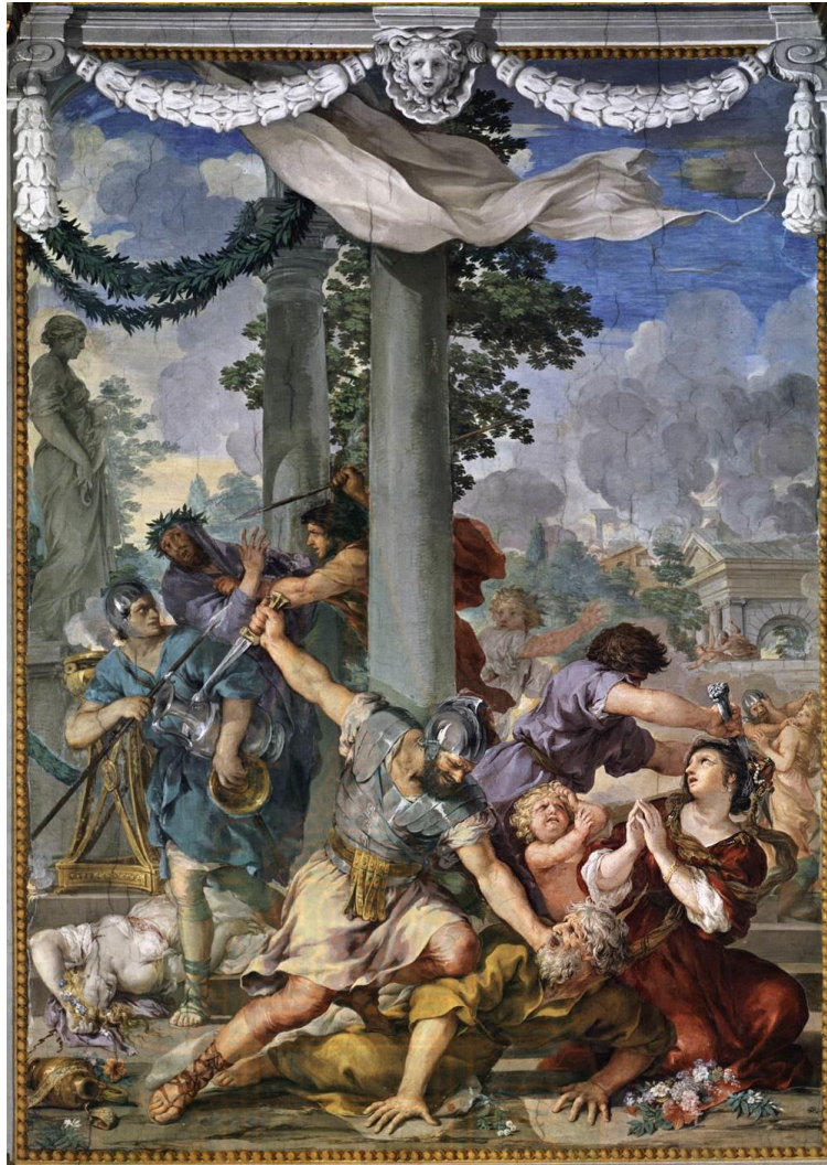
‘Age of Iron’ ภาพวาดของ ‘Pietro da Cortona’ การใช้อาวุธ กำลังเกิดความรุนแรง แย่งชิงทรัพย์สิน เช่นฆ่าชีวิตผู้คนเป็นสิ่งที่เกิดขึ้นกับชีวิตของผู้คนยุคเหล็ก ที่มา Palazzo Pitti, Florence.